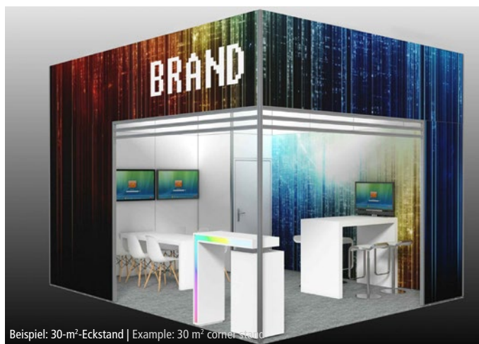
Beispiel: 30-m²-Eckstand | Example: 30 m² corner stand